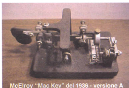
McElroy "Mac Key" del 1936 - versione A