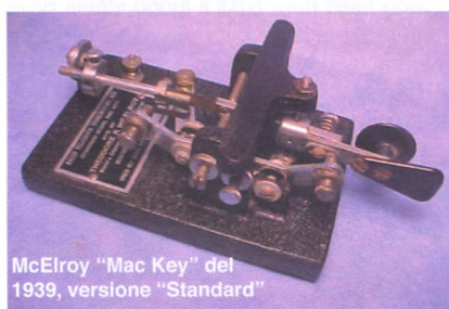
McElroy "Mac Key" del 1939, versione "Standard"