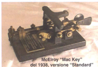
McElroy "Mac Key" del 1938, versione "Standard"