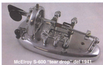
McElroy S-600 "tear drop" del 1941