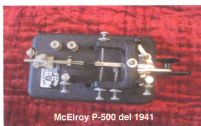
McElroy P-500 del 1941