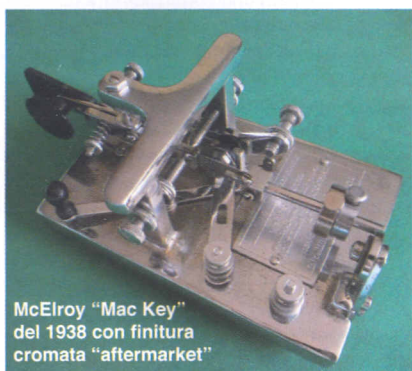
McElroy "Mac Key" del 1938 con finitura cromata "aftermarket"

Nelle foto potete apprezzare i miei McElroy in collezione.