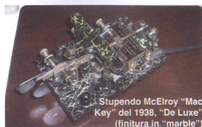
Stupendo McElroy "Mac Key" del 1938, "De Luxe" (finitura in "marble")